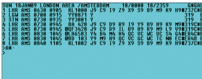
Availability Direct Request – La visualizzazione neutrale delle disponibilità ti consente di accedere – effettuando un'unica ricerca – sia ai vettori tradizionali che a quelli Low Cost.

La nuova integrazione dei vettori Low Cost su Galileo assicura alle agenzie business travel clienti Galileo la possibilità di accedere ai contenuti Low Cost nella maniera più efficiente e di poter così offrire alle aziende clienti la più ampia e completa gamma di servizi, comprese le opzioni di imbarco rapido e di gestione del bagaglio, particolarmente importanti per chi viaggia per lavoro.